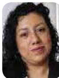
Vania Pérez Morales

La presentación de 15 recomendaciones para reformar el Sistema Nacional Anticorrupción por parte de su presidenta, Vania Pérez Morales, pone sobre la mesa una realidad incómoda pero ineludible: la corrupción en México dejó de ser un problema administrativo para convertirse en un asunto de seguridad nacional. Reconocer que la seguridad pública es uno de los sectores más infiltrados, con un alarmante 86.7 por ciento de penetración según datos del Inegi, obliga a replantear de fondo el diseño y la eficacia del SNA, hoy claramente rebasado. No se trata solo de ajustar normas o reforzar discursos éticos, sino de construir una política anticorrupción transversal y de Estado que rompa el vínculo entre instituciones públicas y delincuencia organizada. El impacto no es menor: casi la mitad de los mexicanos enfrenta actos de corrupción en servicios básicos, mientras que las pérdidas económicas estimadas alcanzan hasta el 5 por ciento del PIB, una sangría constante para el desarrollo y la confianza pública. Las consultas para la renovación del sistema abren una oportunidad que no debería desperdiciarse con simulaciones o reformas cosméticas. Si el Congreso realmente asume estas recomendaciones, el combate a la corrupción puede dejar de ser un eslogan recurrente y convertirse en una estrategia estructural. De lo contrario, el SNA seguirá siendo un andamiaje institucional sin dientes frente a uno de los principales lastres del país.