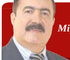
Columna de Miguel Ángel Vega C.