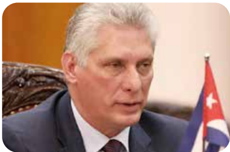
Miguel Díaz Canel