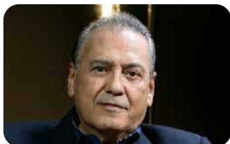
Manlio Fabio Beltrones